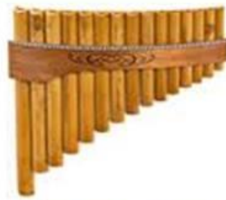
αυλός του Πανός